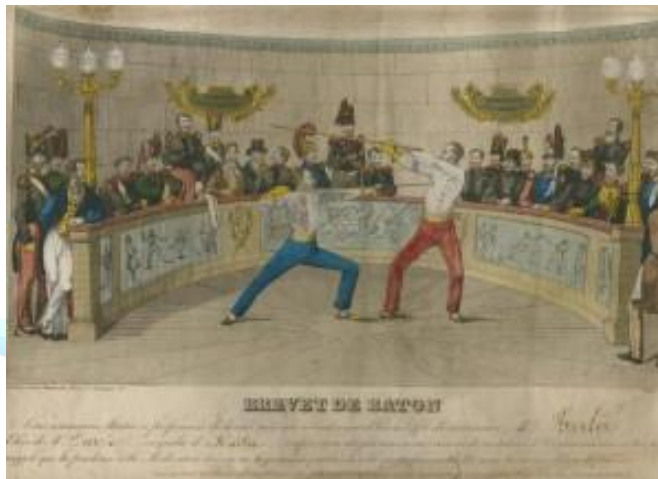
Brevet de Maître de bâton (1839), délivré à Chalons-sur-Saône