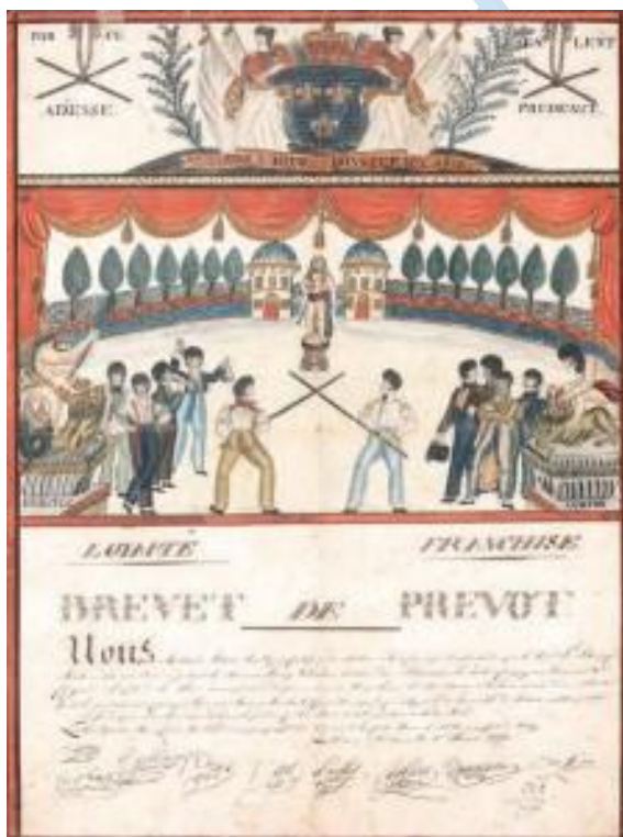
Brevet de Prévôt de bâton (1816, Bordeaux) délivré à un compagnon tanneur