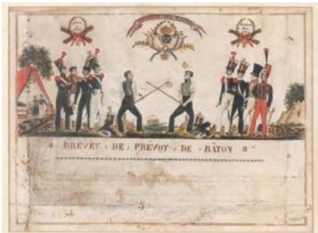
Brevet de Prévôt de bâton (1827, lieu inconnu) délivré à un caporal

de bâton était l'assistant du Professeur principal, c'était donc un peu l'équivalent d'un titulaire moderne d'UC1.