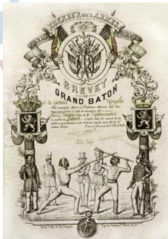
Brevet belge de Prévôt de « grand bâton » (milieu XIX ème siècle). La Belgique était française de 1792 à 1815 et a connu cette discipline par ce biais